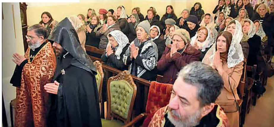
p. 6/ Une région en transition

42/ Արարատը՝ Հայ ժողովուրդի Լինելութեան նշան